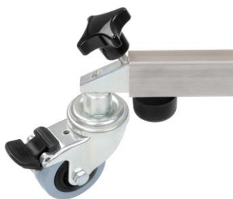
Fig. 9 Lenkrollen wheels (optional)