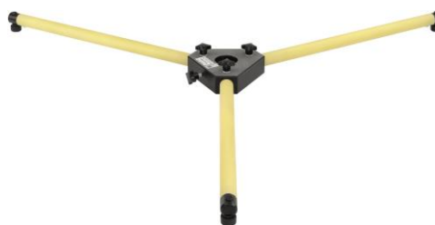
Fig. 10 (optional)